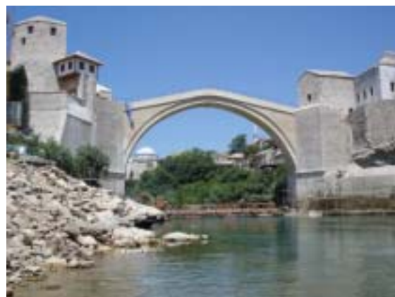
Le nouveau Stari Most, mostar,, juillet 2004

Guernica A.D.P.E. a été fondée en avril 1993, sur le campus du Mirail à Toulouse, en réaction aux campagnes de purification ethnique organisées en Croatie et en Bosnie-Herzégovine et devant « l'impuissance » européenne à faire stopper les massacres. Association militante par nature, Guernica a publié pendant les heures sombres de l'histoire ex-Yougoslave une revue d'information et de mobilisation appelant l'Europe et les Européens à