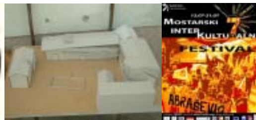
Manifestation du 1 er mai 2003 pour l'obtention d'un centre culturel et associatif indépendant à Mostar. Elle est la première manifestation civile depuis la fin du conflit. Logo du collectif d'associations qui lutte pour l'obtention d'un lieu. Maquette du projet associatif de reconstruction d'un centre (avant la guerre appelé Abrašević) situé sur l'ancienne ligne de front.