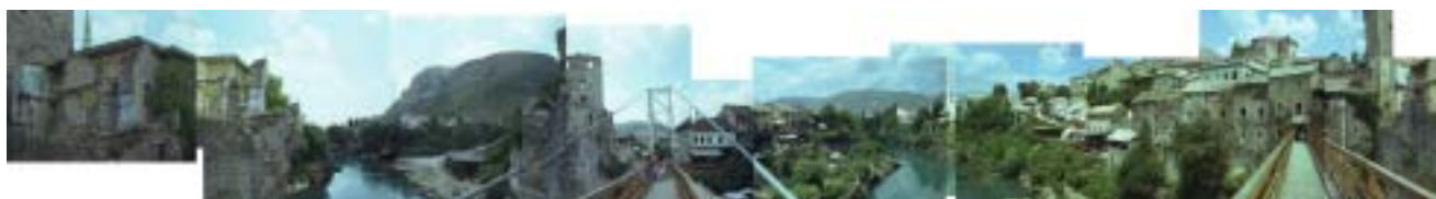
Vue panoramique de la passerelle qui remplace le Vieux Pont 5 (Stari Most) de Mostar

Ainsi, si le développement des deux associations s'est fait autour du Festival Interculturel de Mostar, nos associations souhaitent aujourd'hui, dans un souci de réciprocité, faire aboutir de véritables échanges entre Toulouse, Grenoble et l'ex-Yougoslavie.