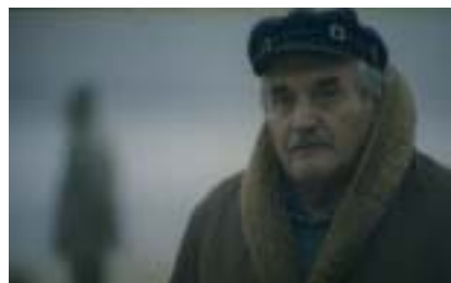
« Bag »