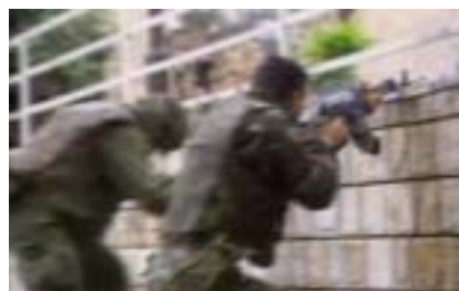
« The Bridge »

Site Internet : http://www.factumdocumentary.com/