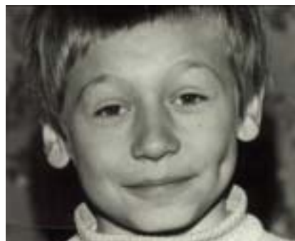
« The boy who rushed »

L'histoire de la destruction, lors de la guerre, des vies humaines et des monuments historiques à Mostar racontée à travers le regard de deux jeunes citoyens de différentes communautés qui veulent vivre dans une ville unifiée.