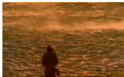
« Bag »