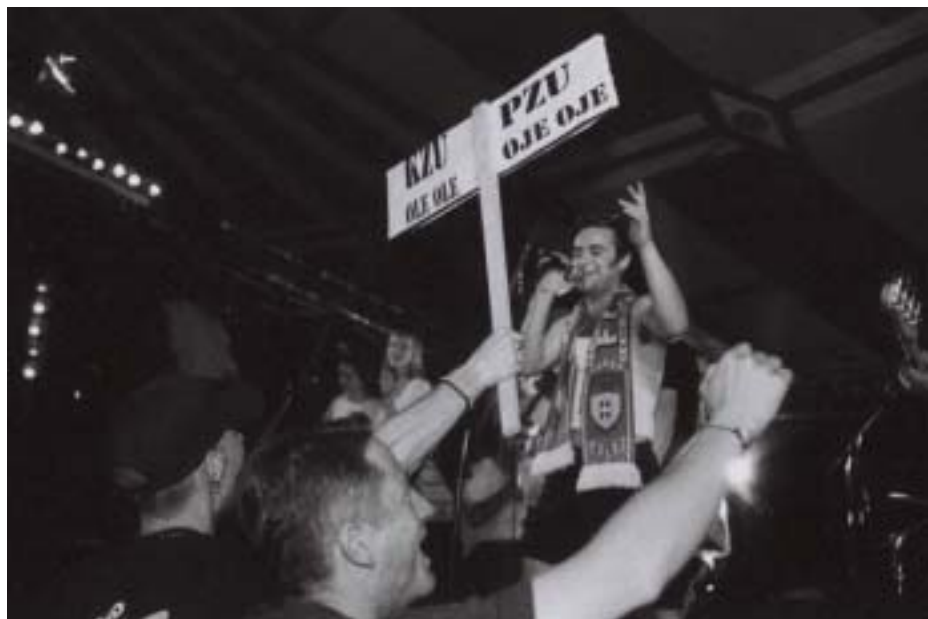
En concert sous le chapiteau Latcho Drom, Mostarski Interkulturalni Festival, Mostar, 2001.

Le style est difficile à définir entre du punk doux et des ajouts de pop-hard-rock d'origine midji. La musique comme les paroles jouent sur l'ironie de la vie en Bosnie-Herzégovine. Un curieux mélange sonore et visuel qui a valu au groupe plusieurs prix pour leurs prestations scéniques. Un vent d'absurde et d'humour punk décalé et grinçant. A découvrir !