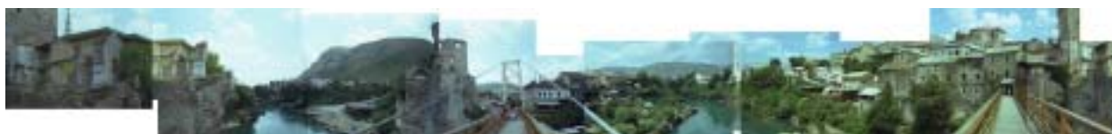
Vue panoramique de la passerelle qui remplace le Stari Most (Vieux Pont) de Mostar.

Depuis 1997, Guernica et Drugi Most (association partenaire de Grenoble) co-organisent en coopération avec des structures locales le Festival Interculturel de Mostar . Après plus de sept années d'un travail de terrain acharné, les deux associations ont acquis une véritable légitimité dans leurs actions soutenues à l'échelle nationale et internationale tant par des partenaires institutionnels que citoyens.