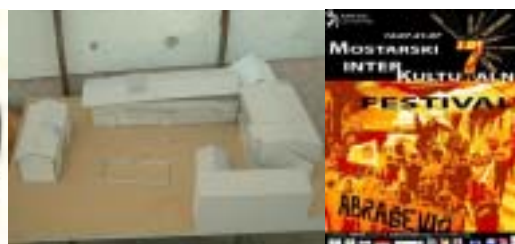
Manifestation du 1 er mai 2003 pour l'obtention d'un centre culturel et associatif indépendant à Mostar. Elle est la première manifestation civile depuis la fin du conflit. Logo du collectif d'associations qui lutte pour l'obtention d'un lieu. Maquette du projet associatif de reconstruction d'un centre (avant la guerre appelé Abrašević) situé sur l'ancienne ligne de front.